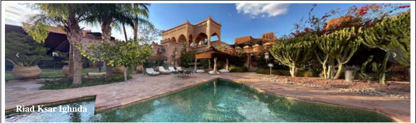
Riad Ksar Ighnda