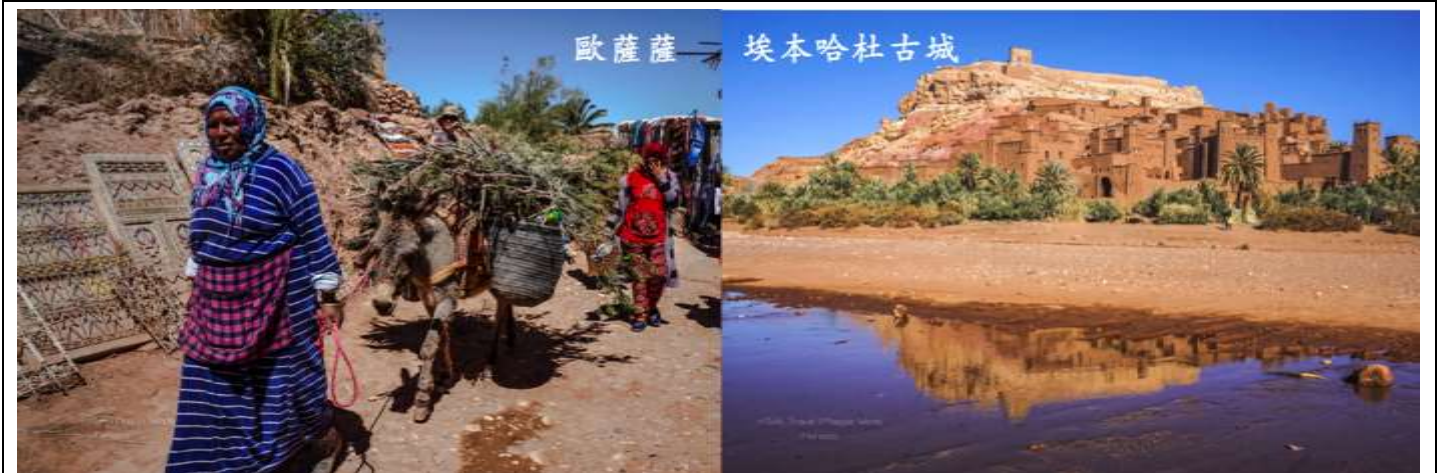
歐薩薩 → 埃本哈杜古城