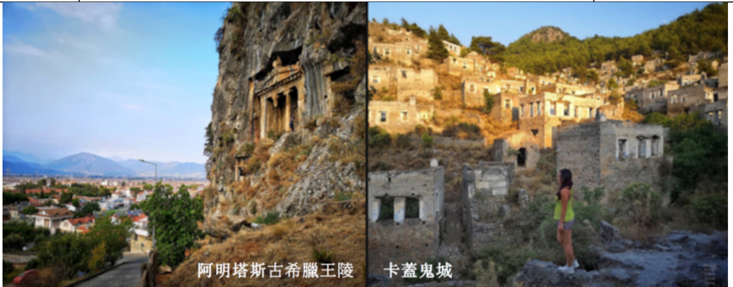
阿明塔斯古希臘王陵

• 西米廣場 Plateia Simi 中維納斯神廟的遺址 • 鄂圖曼帝國的清真寺 Mosque of Suleiman • 裝飾藝術博物館 Museum of Decorative Arts • 考古博物館 Archaeological Museum • 聖母教堂 Church of our Lady of the Castle 等等除了以上歷史性景點，舊城區有很多人氣商店和餐廳酒吧等休閒之選。 中午自由在城中午餐，下午約二時往海港口乘船到土耳其馬爾馬里斯（Marmaris）（約 60 分鐘程） 是日含早，晚餐