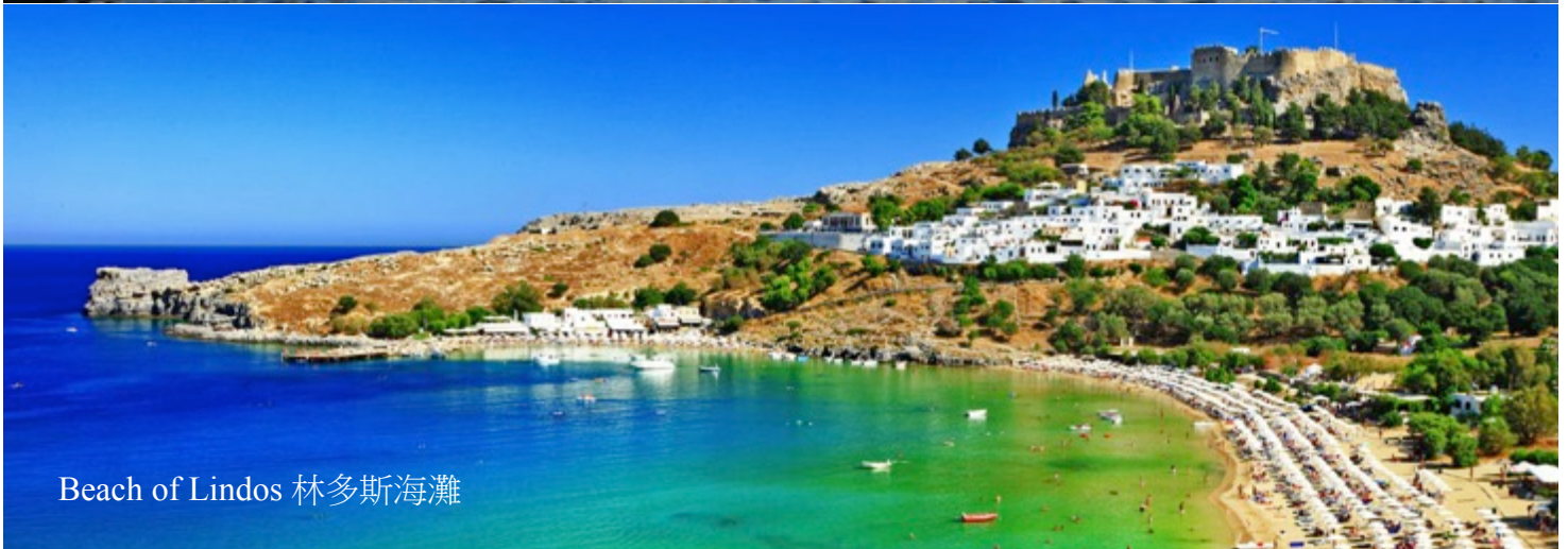
Beach of Lindos 林多斯海灘

希臘[羅得島]為南愛琴海上文明起源地之一，集地中海風情、歷史、文化、美食於一地，距土耳其僅 18 公里。