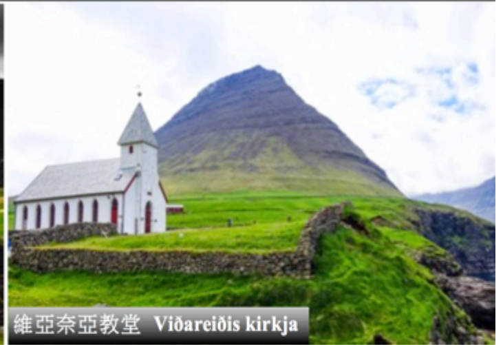
維亞奈亞教堂 Viðareiðis kirkja