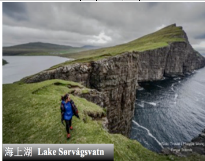
海上湖 Lake Sørvágsvatn