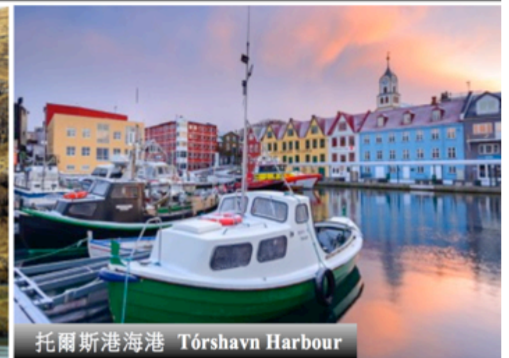
托爾斯港海港 Tórshavn Harbour